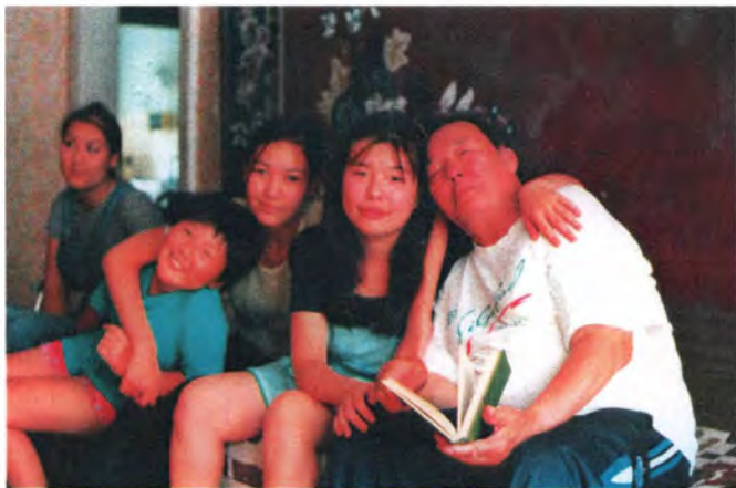
Все внучки в гостях у ата. 1999 г.