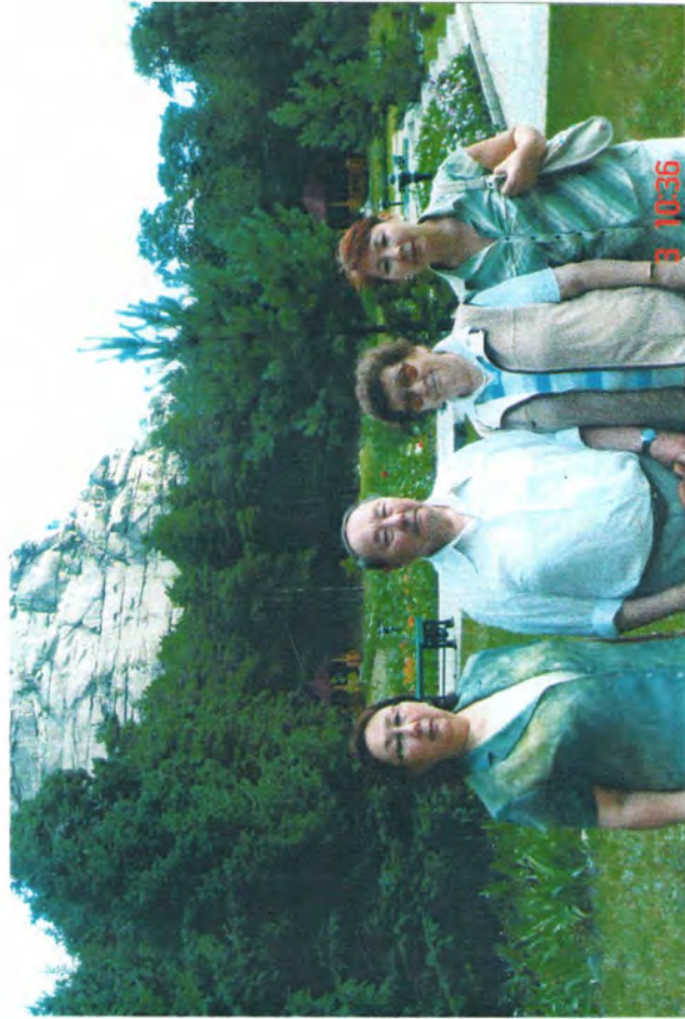
Боровое, Ок-жетпес, 2006 г.