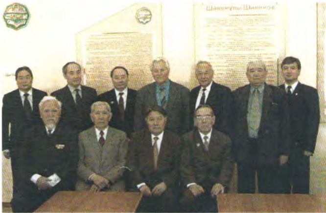
Ветераны войны и труда в Северо-Казхстанском государственном университете им. М.Козыбаева 9 мая 2003 г. Петропавлоск