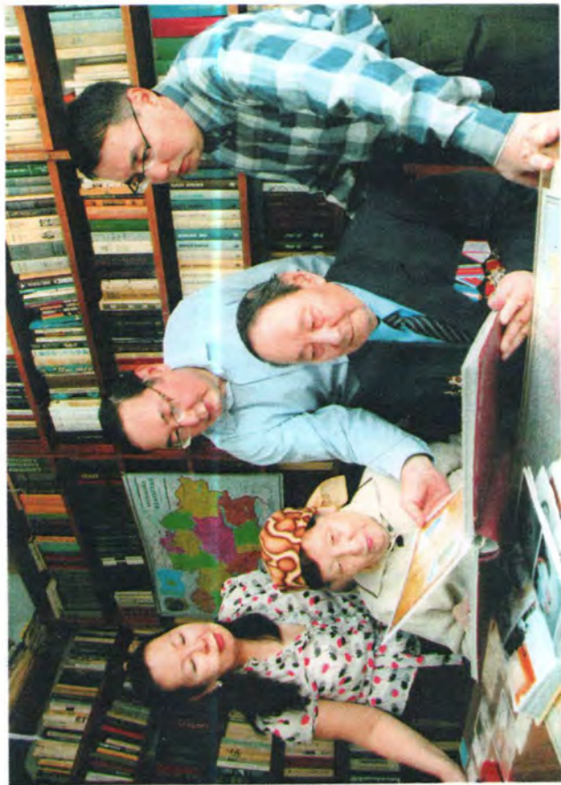
Семья Джунусовых. 2008 г.