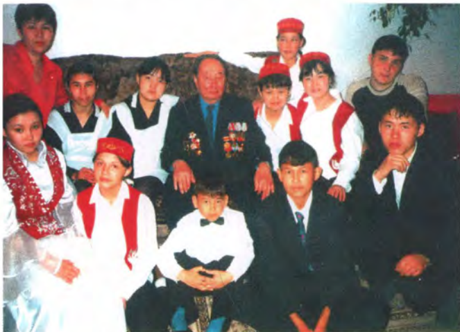
В детском доме для детей - сирот. Петропавлоск, 2004 г.