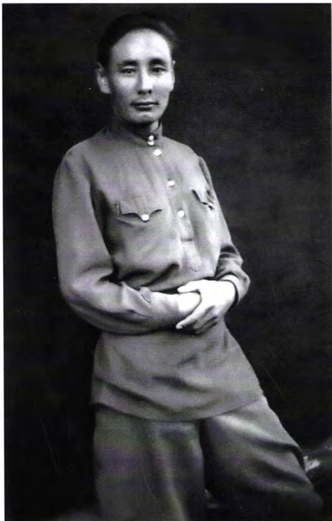
Преподаватель восьмилетней школы, с.Ильинка Аккаинского р-на, 1949 г.